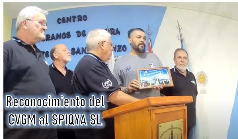
Reconocimiento del CVGM al SPIQYA SL