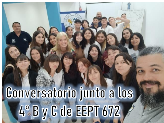
Conversatorio junto a los 4° B y C de EEPT 672

Desde que los trabajadores de todo el mundo, tomamos conciencia de que ES POR la ORGANIZACIÓN SINDICAL que se pueden mejorar nuestras condiciones de vida y las de nuestras familias ; a partir de la negociación colectiva con empleadores, promoviendo leyes laborales, previsionales, etc., el SINDICATO como institución, y sus dirigentes, han sido víctimas de distintas campañas de demonización y desprestigio, pagadas por grandes empresarios que solamente ven en las mejoras salariales y de condiciones de trabajo, disminución de sus márgenes de ganancias, SIN VER NI VALORAR LA MEJORA que ello genera en LA COMUNIDAD (de la que usan sus recursos humanos, jurídicos, educativos, naturales, ambientales, etc).